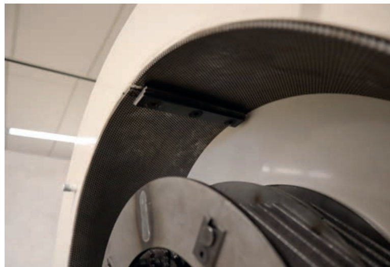
De grootte van de gaatjes bepaalt de uiteindelijke korrelgrootte van het product.