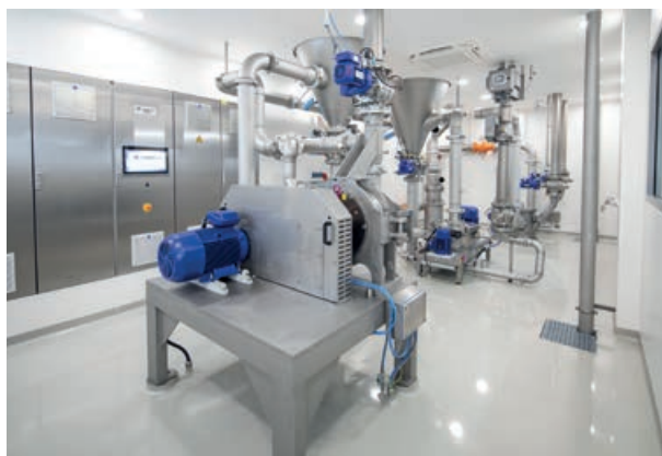
Het testcentrum van Hosokawa in het Duitse Augsburg.

Schop vertelt dat testen vaak begint het met een validatietest op laboratoriumschaal. "Je maalt bijvoorbeeld een kilo aan grondstoffen met één of twee typen molens