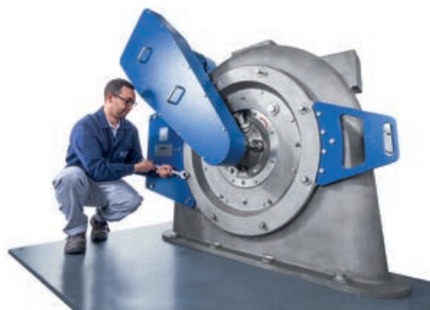
Hosokawa levert een brede range aan droog-, meng-, maal- en classificeermachines en de ondersteunende expertise hiervoor.