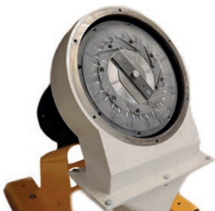
Deze schijvenmolen van Jansen & Heuning wordt gebruikt voor het malen van producten waarbij de verdeling van de gemalen fractie nauwkeurig moet zijn.

Jansen & Heuning staat bekend om zijn solide advisering, strakke prijs en goede service. De eigen engineeringafdeling werkt ideeën uit tot functionele oplossingen in technische modellen en specificaties, het malen in een testopstelling laat zien wat de klant van de productie verwachten kan. Aan dit pakket zal net als aan de technologie op zich weinig veranderen, denkt De Jong, maar verschuiving in accenten is er altijd wel. “Wij bewegen met de markt mee.”