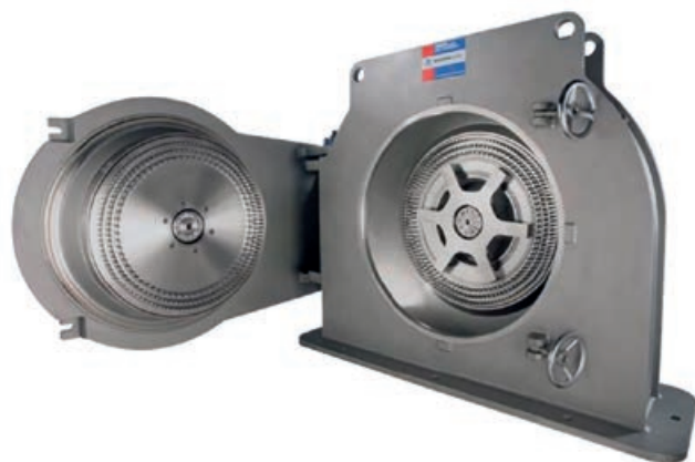
De Hosokawa Alpine Contraplex is een fijnprallmolen of pinmolen (net als een hamermolen een voorbeeld van een slagmolen) met twee aangedreven contraroterende pin-schijven, gebruikt om poeders zeer fijn te malen.